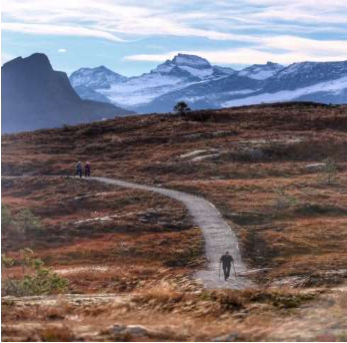
Turveg til Fagrefjellet