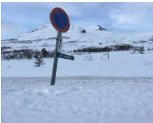
Behov for meir parkering?

Ein tendens er at ungdom deltek meir i uorganisert aktivitet no enn før. Dei driv meir eigentrening på helsestudio, trening i trimparkar, på sykkelsetet, scating og anna aktivitet, der dei er sin eigen herre utan å vere del av eit lagspel.