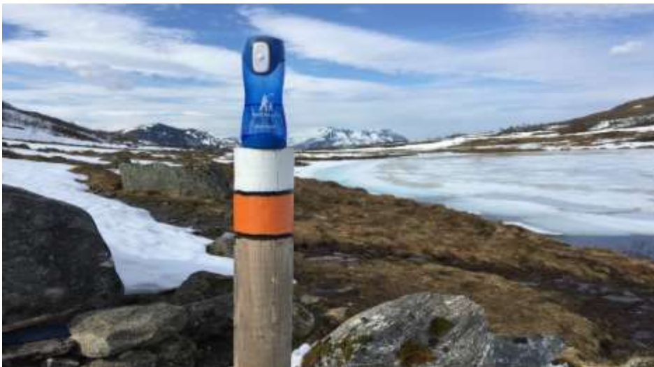
Fjølestolpen ved Melsetvatnet – FTF 2018

Denne årlege turkonkurransen får vel 900 personar i snitt pr. år, ut på tur og i fysisk aktivitet. Ut på tur i den fantastiske naturen vår, på leit etter nye plassar ein aldri før har vore.