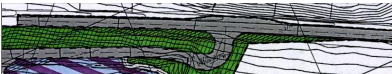
Figur 3: Utsnitt av gjeldande reguleringsplan, plan-ID 15282010004 (Sykkylven kommune)

Planen er godkjend, og krysset er bygd med tilhøyrande passeringslomme. Ettersom dette var nytt kryss på fylkesveg, må vegforvaltar for fylkesvegen både ha godkjent planen og det utførte tiltaket som berørte fylkesvegen (ferdigbefaring og overlevering).