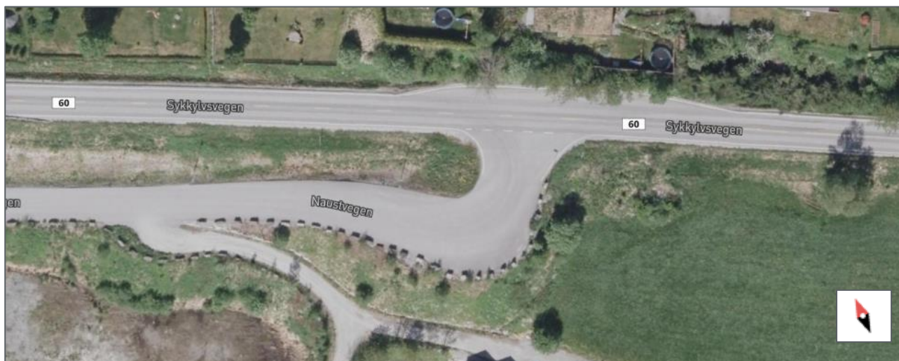
Figur 1: Kryssområdet, fv. 60 Sykkylvsvegen / kv- 1090 Naustvegen

I samband med detaljregulering av Aursnes industriområde (Plan-ID 15282022003) er det reist spørsmål om krysset mellom fv. 60 Sykkylvsvegen og kv. 1090 Naustvegen har god nok standard i høve til framtidig trafikk i krysset.