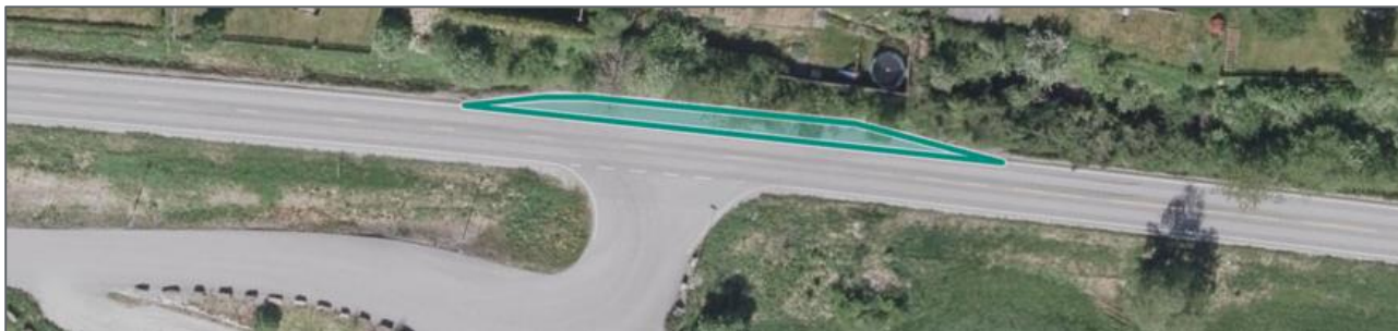
Figur 2: Vegglomme registrert i NVDB (vegkart.no)

Reguleringsplanen for krysset blei godkjend av Sykkylven kommune i 2010: PlanID 15282010004). I tillegg til sjølve krysset med fylkesvegen, omfatta planen austre del av industriområdet i tillegg til kaianlegget. Eit poeng med planen var at ein skulle sikre tilkomsten til kaianlegget i høve til utskiping av tømmer.