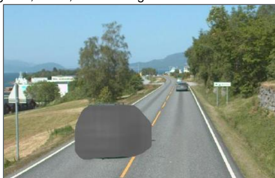
Figur 4: Sikt mot krysset, 120 m avstand (vegbilder.atlas.vegvesen.no, juni 2023)

Passeringslomme er eit forenkla alternativ til kanalisering med venstresvingefelt, og er i dette tilfellet etablert på ei rettstrekning med god oversikt. Vegvising til Aursneset industriområde er skilta med tabellvegvisar før sjølve krysspunktet, og gir då også litt ukjende trafikantar