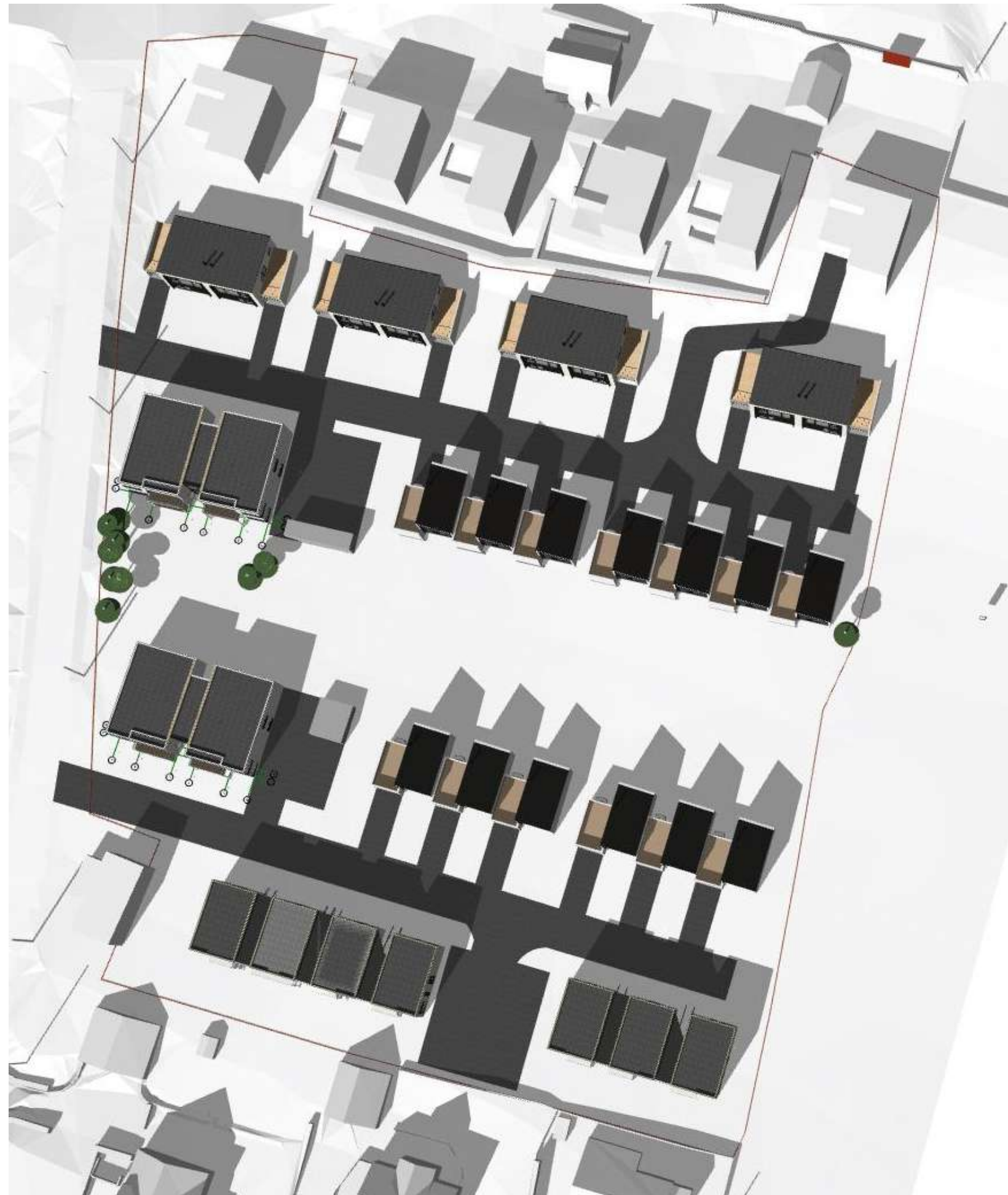
21 Mars/Sep. kl. 15:00