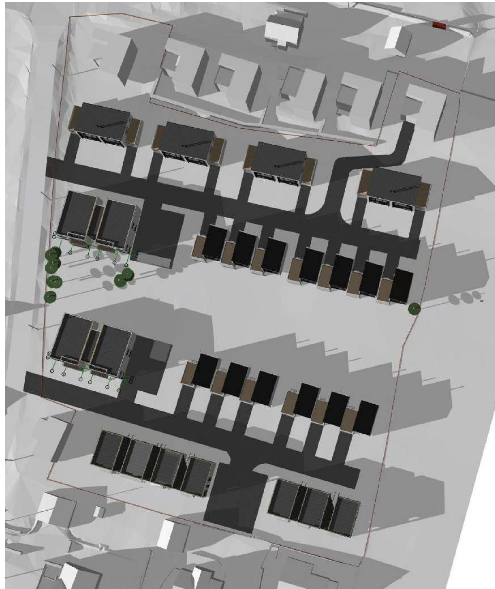
21 Mars/Sep. kl. 18:00