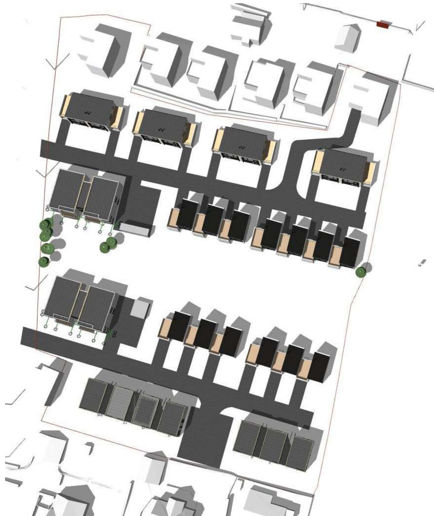
21. juni kl. 15:00