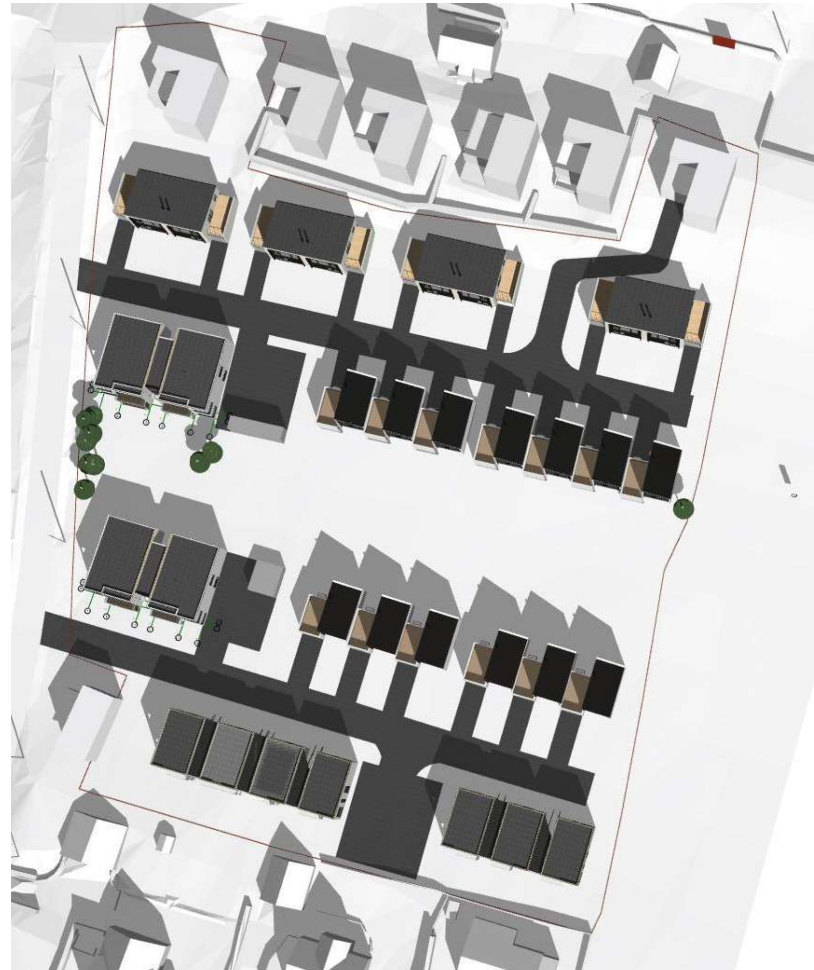
21 Mars/Sep. kl. 12:00