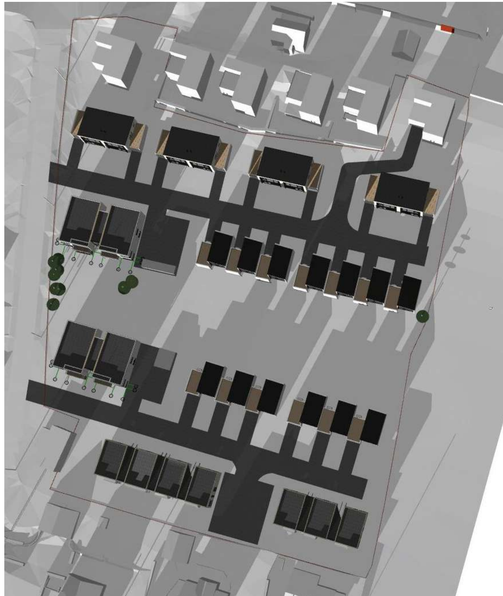
21 Des. kl. 15:00