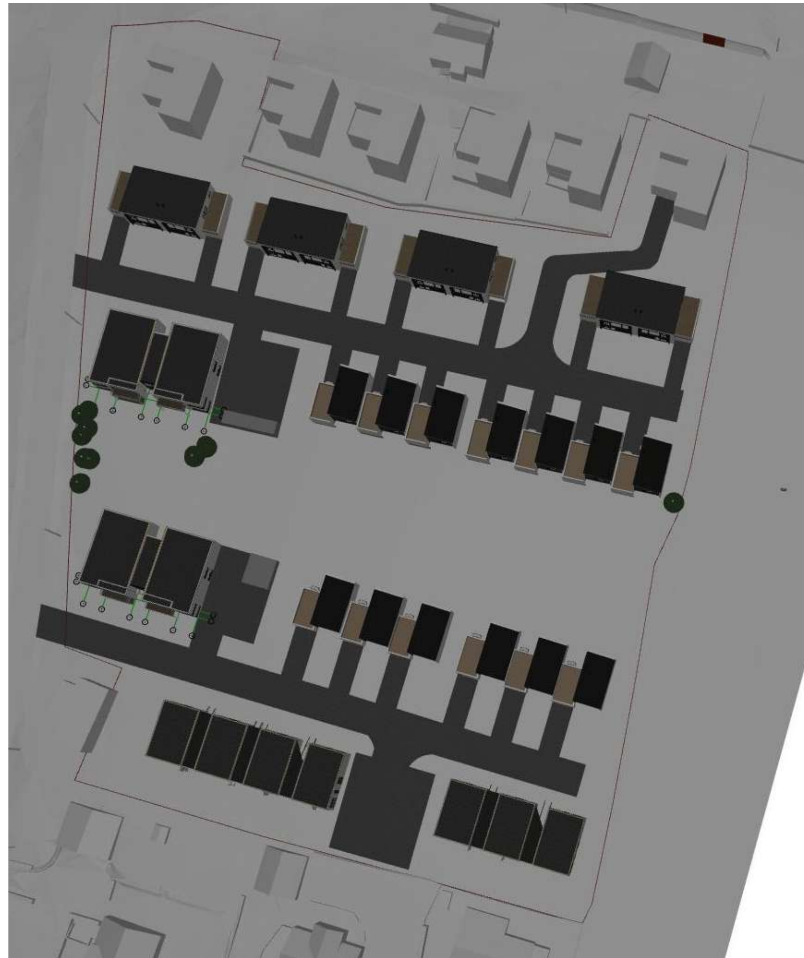
21 Des. kl. 18:00