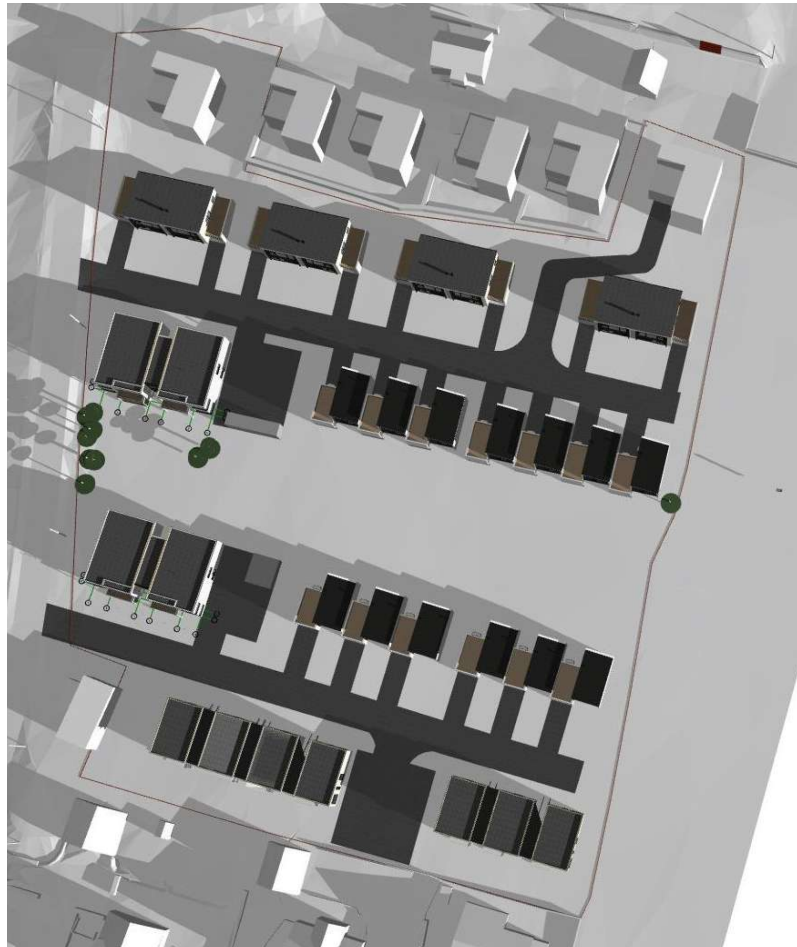
21 Mars/Sep. kl. 09:00