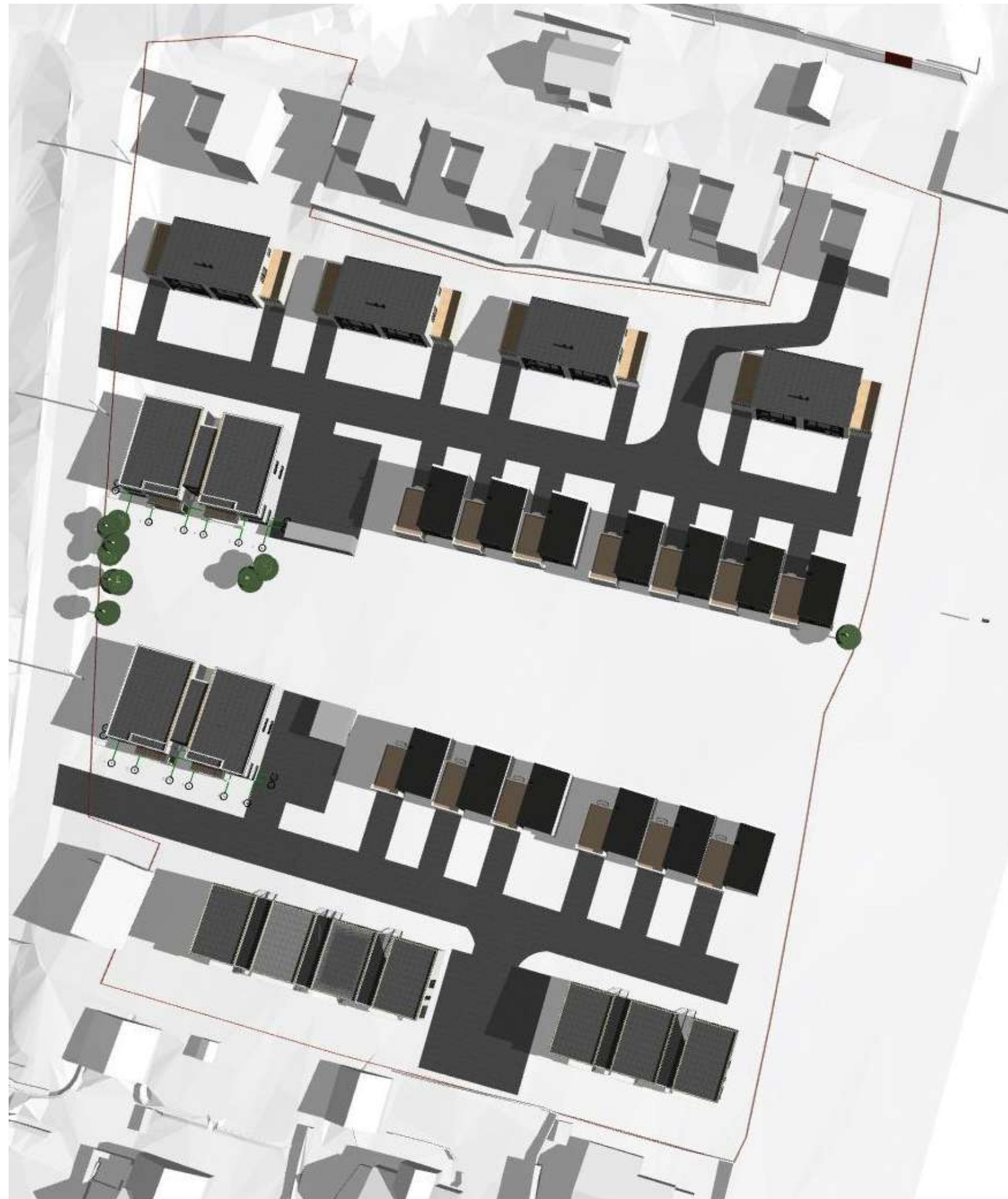
21. juni kl. 09:00