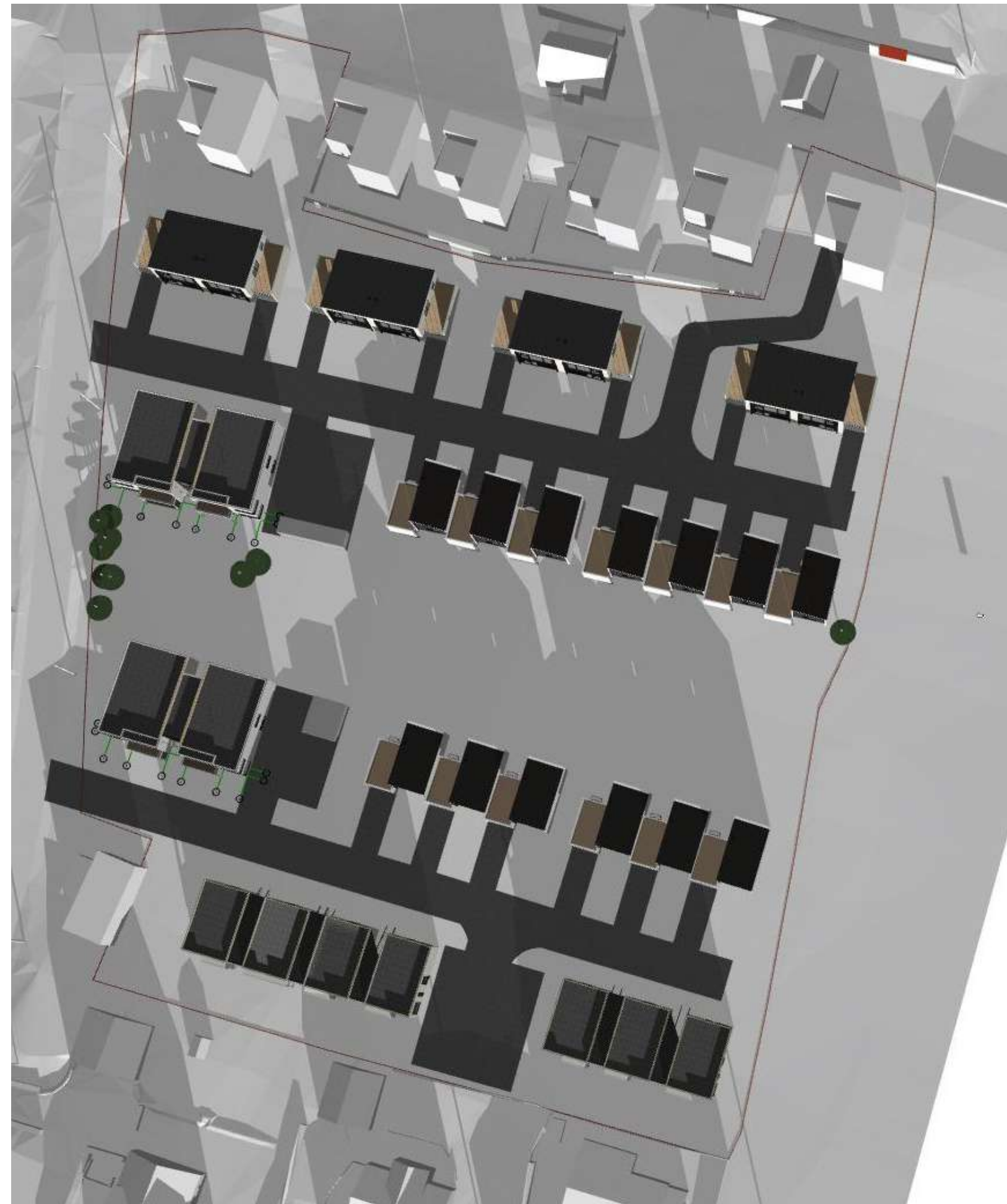
21 Des. kl. 12:00