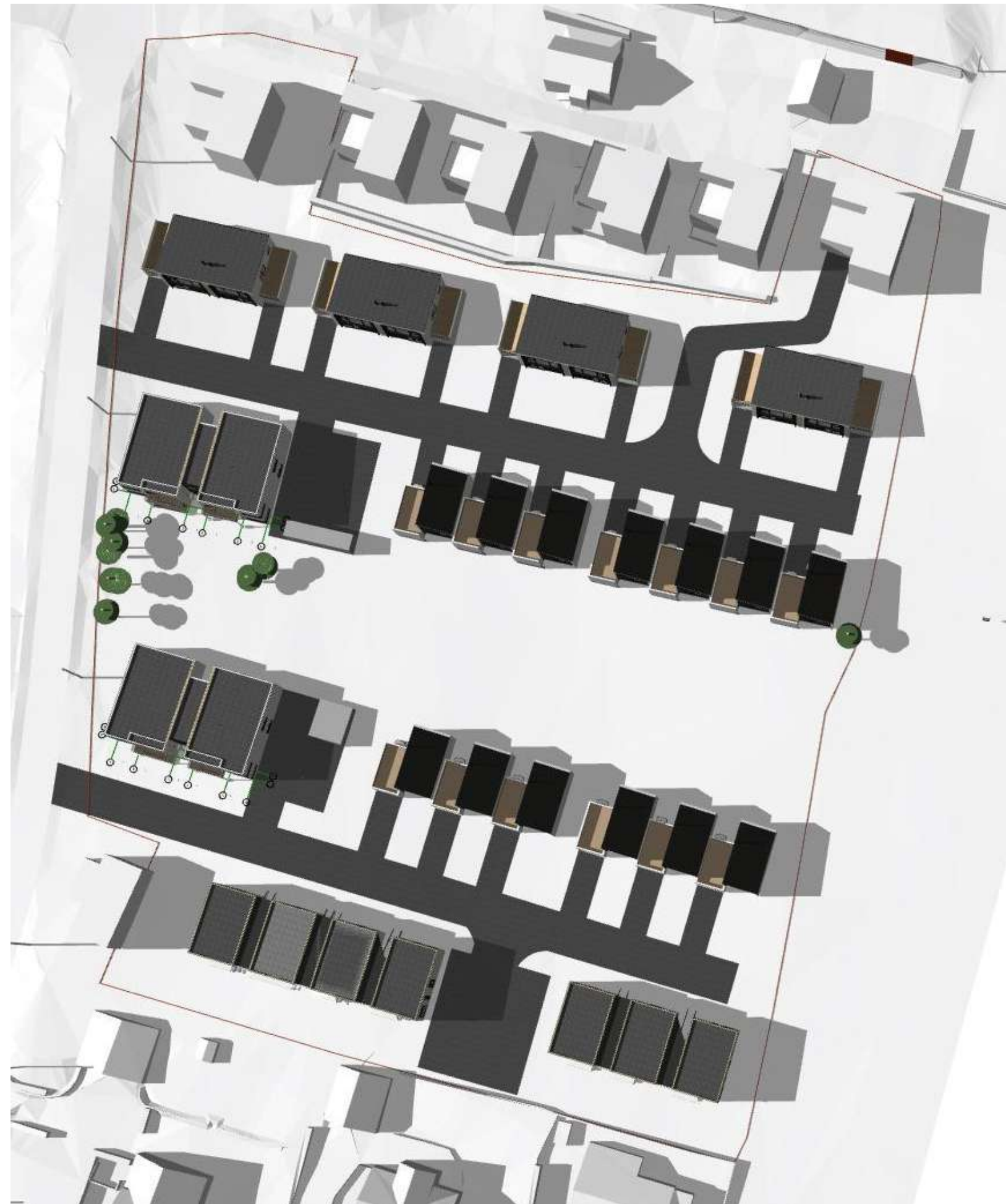
21. juni kl. 18:00