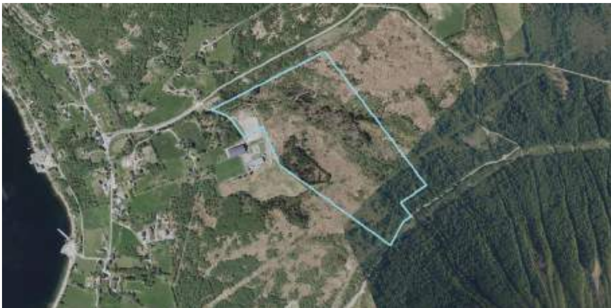
Figur 6 Området sett mot ortofoto

Området ligger i Hundeidvik, opp mot fjellet. Ubebygde områder er i stor grad klassifisert som produktiv skog, og annet markslag jf. gårdskart på nett.