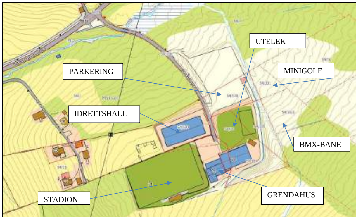
Figur 1 Oversikt over område i bruk av idrettslaget i dag

Hundeidvik idrettslag driver med mange ulike aktiviteter i området. De disponerer i dag i hovedsak deler av og eiendommene 54/7, 9, 15/1, 76,104, 105, 120 og 131.