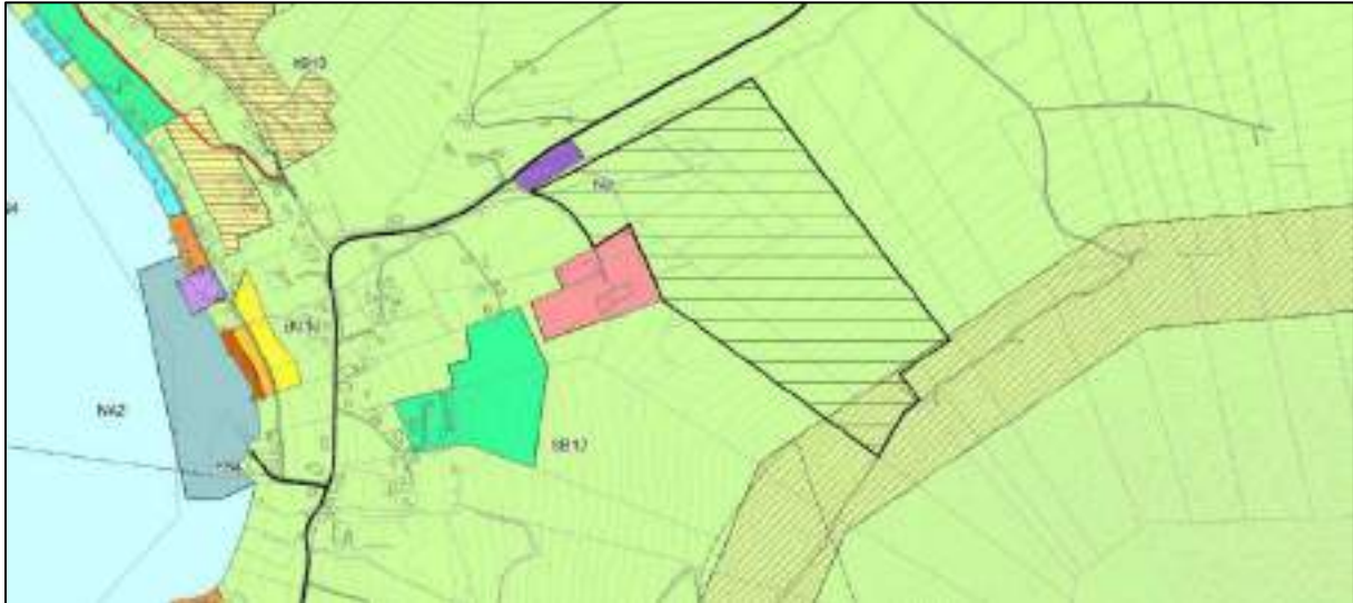
Figur 5 Ønsket område sett mot gjeldende kommuneplan

Området er i gjeldende kommuneplan avsatt til LNFR (for tiltak basert på gardens ressursgrunnlag) og ligger tilgrensende området som i dag benyttes av idrettslaget. Dette er avsatt til offentlig og privat tjenesteyting. Et mindre område i sør er avsatt til høgspenntrase (H370)