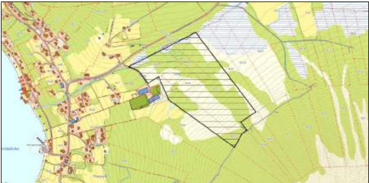
Figur 2 Areal som ønskes omdisponert

I samarbeid med de fleste grunneierene ønsker man å spille inn et større område som kan legges til rette for videre utvikling av Hundevik idrettslags aktiviteter. Grunneier av 54/7 har det ikke blitt avholdt møte med, siden grunneier bor i Bergen. Figuren under viser ønsket areal. Arealet ønskes avsatt til fritids- og turistformål. Man ser for seg utviding av parkeringsplassen samt tilrettelegging av et større areal som kan utvikles etter idrettslagets ønsker og behov. Det kan være temparker, sykkelstier, ulike former for idrettsbaner og lignende som vil passe inn under overordna formål. Området som man ønsker å omdisponere er avklart med de ulike grunneierne.