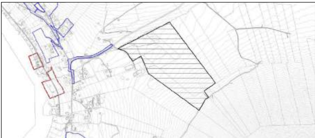
Figur 4 Området sett mot gjeldende og pågående reguleringsplaner i området

Det er ingen reguleringsplaner for området pr. i dag.